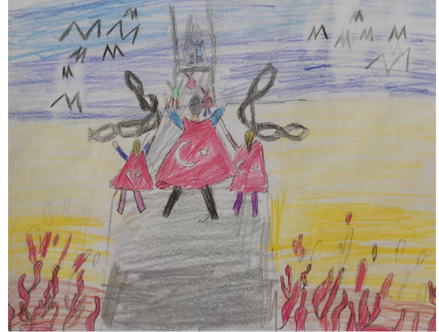
5-E Elif UZUNASLAN